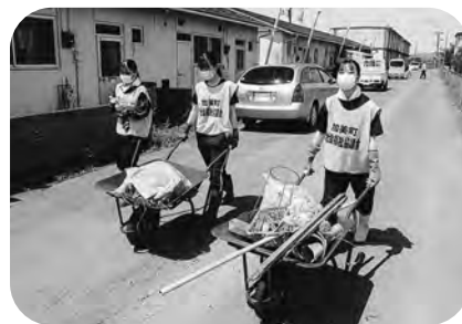
▲ボランティア活動の推進 (災害ボランティア活動)