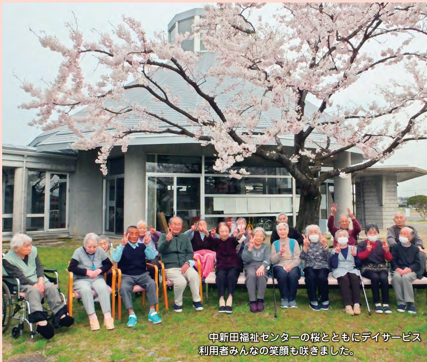
中新田福祉センターの桜とともにデイサービス 利用者みんなの笑顔も咲きました。