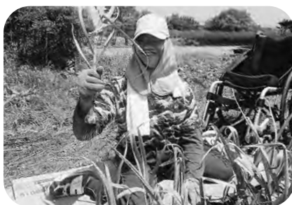
▲クローバーハウスの にんにく収穫作業