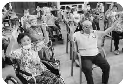
▲宮崎デイサービスセンター