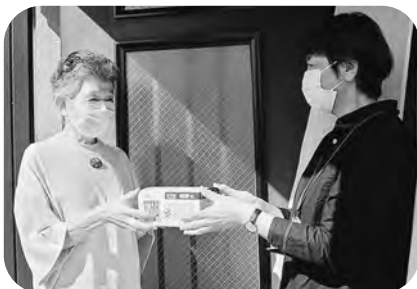
▲一人暮らし高齢者訪問事業