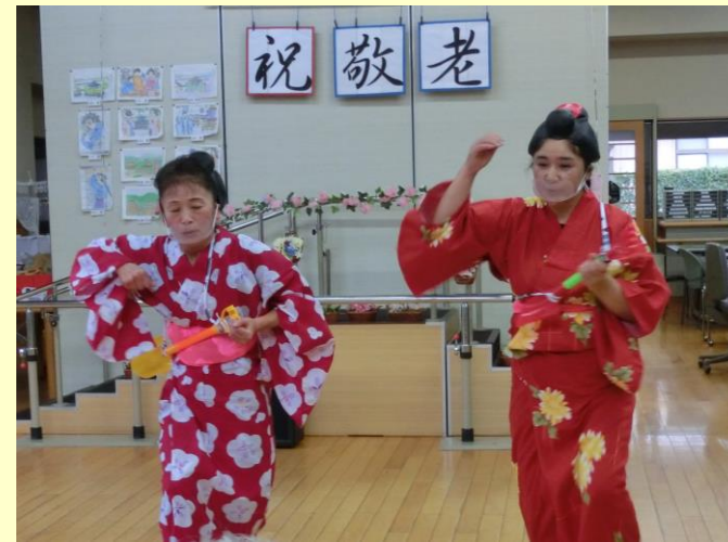
▲夏祭りに敬老会と、季節の行事も盛りだくさん♪職員も一緒に楽しく盛り上げます！！