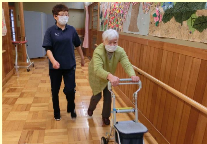
▲施設内(宮崎福祉センター)をお散歩中♪ 広～い館内を生かして自然と機能訓練