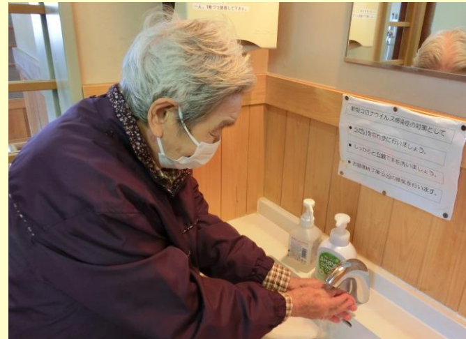
▲利用者様の通所時を中心に、非接触型体温計による 検温と手洗い、手指消毒を念入りに行っています。

当施設では毎日、感染症対策を十分に行っています。 皆様のご利用をお待ちしております。 見学等、利用に関するご相談は下記までお気軽に♪ 随時対応致します！