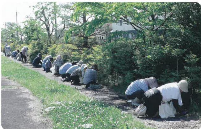
協力して草取りをする会員の皆さん。

初日は生憎の雨となりましたが、2日目は明るい日差しの下、活動することができました。この活動は、地域社会に貢献するとともに、会員皆さんの心身の健康も促進しています。コロナ前の日常を取り戻し、会の活動も、町全体も活性化していくことでしょう。