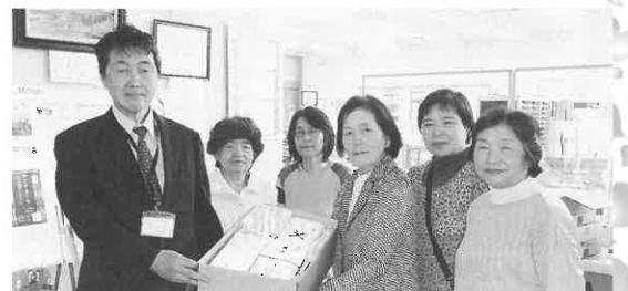
JA 加美よつば女性部色麻支部の皆さん。