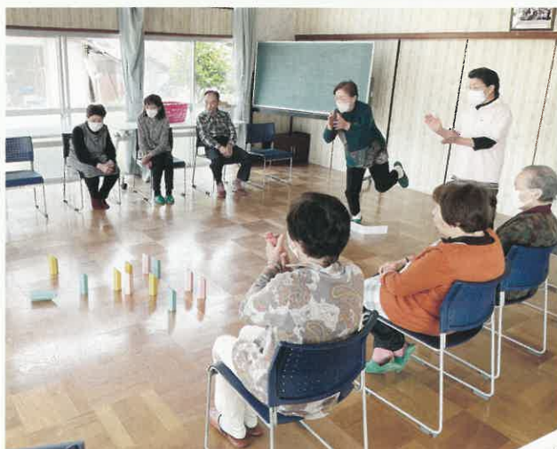
レク協の皆さんとモルックを楽しむ鷹巣地区の皆さん。

令和5年5月10日（水）、鷹巣地区にて行われた活き生き長生き教室では、色麻町レクリエーション協会の皆さんと一緒にモルックで盛り上がり、最後に、参加された皆さんでお茶会をしました。地域の皆さんが顔を合わせる機会が回復しつつあります。