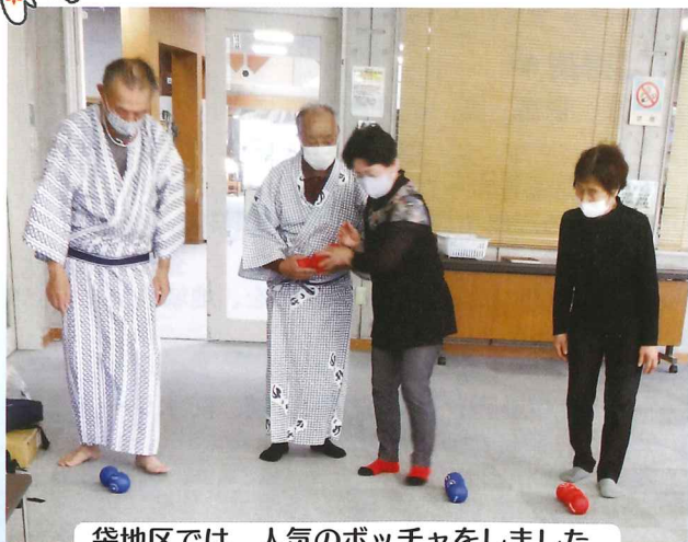
袋地区では、人気のボッチャをしました。