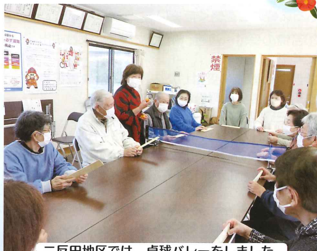
二反田地区では、卓球バレーをしました。

コロナ禍が始まってから、ミニデイはずっと休止になっていましたが、ワクチン接種を経て、感染対策の工夫をしながら、少しずつ再開し始めています。完全に元通りとはいきませんが、地区のみんなで集まって、ゲームをしたりお話をしながら、久しぶりのミニデイを堪能されていました。人との交流は健康寿命を伸ばすことにもとても効果があります。感染対策をしながらではありますが、ふれあいが戻りつつあります。