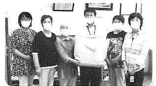
色麻町婦人会の皆さん