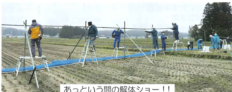
あっという間の解体ショー!!