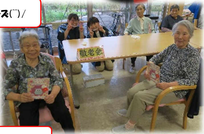
敬老会のプレゼントです！