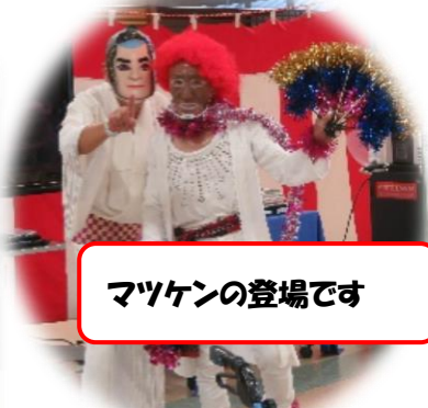
マツケンの登場です