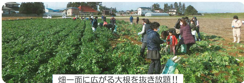
畑一面に広がる大根を抜き放題!!