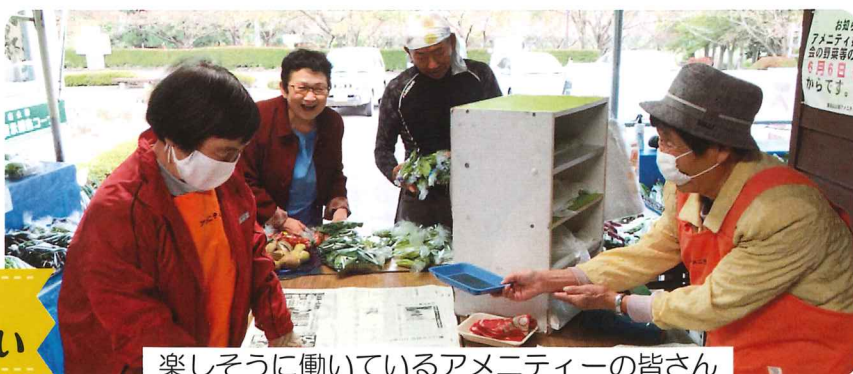
楽しそうに働いているアメニティーの皆さん