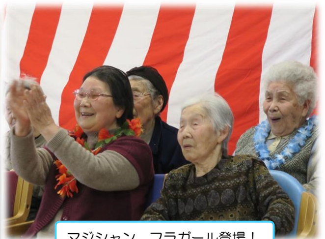
マジシャン、フラガール登場！