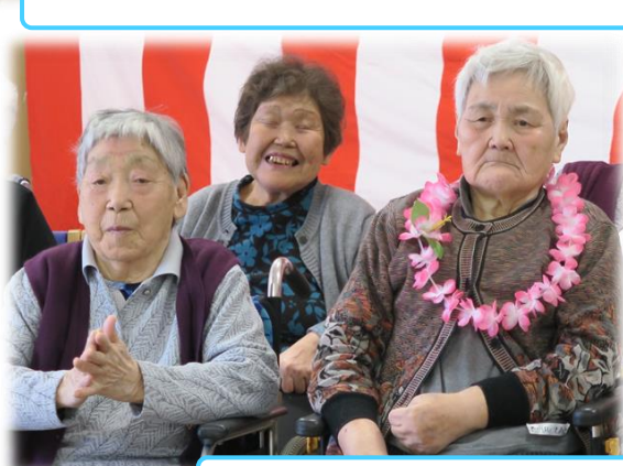
大きな笑いに包まれました！