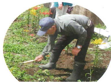
山田さんの鎌さばき！