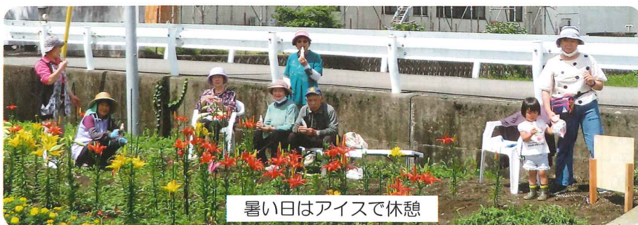
暑い日はアイスで休憩

皆さんの支え合う気持ちが色鮮やかな花々を咲かせているきよみず花壇は、地域支え合いの輪をつなぐ拠りどころとなっています。