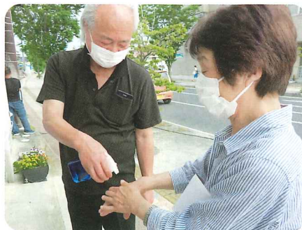
お店の中に入る前は、アルコールでしっかり手の消毒。