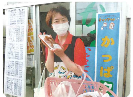
今夜のおかずです。 うれしい(^^)