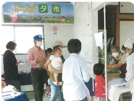
社会的距離をふまえ、店内に入れるのは5人まで。

困っている人がいればみんなで支え合って乗り越えることが、地域共生社会を実現するために必要なことのひとつだといえます。