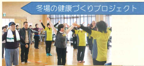
冬場の健康づくりプロジェクト