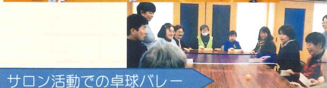
サロン活動での卓球バレー

サロン活動は4年目になり、地区住民にも浸透し、参加人数も増えてきました。「卓球バレー」も取り入れ、男性参加者も増えてきました。