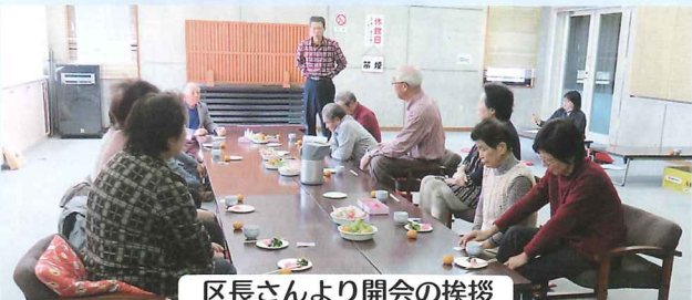
区長さんより開会の挨拶