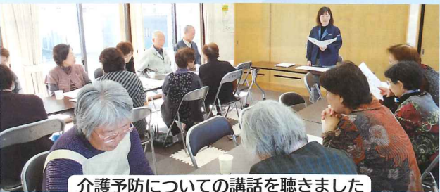
介護予防についての講話を聴きました