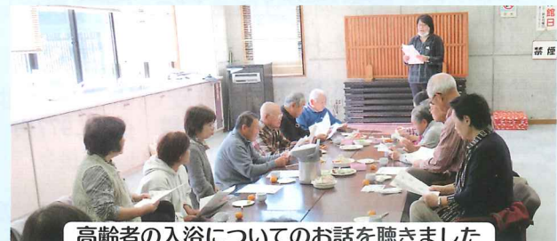
高齢者の入浴についてのお話を聴きました