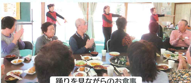
踊りを見ながらのお食事