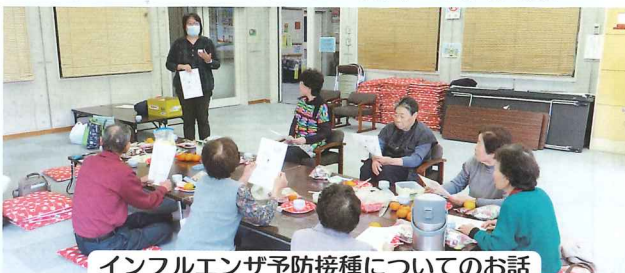
インフルエンザ予防接種についてのお話