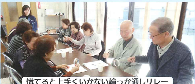
慌てると上手くいかない輪っか通しリレー