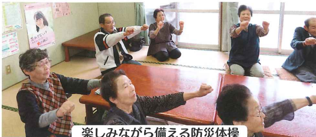
楽しみながら備える防災体操