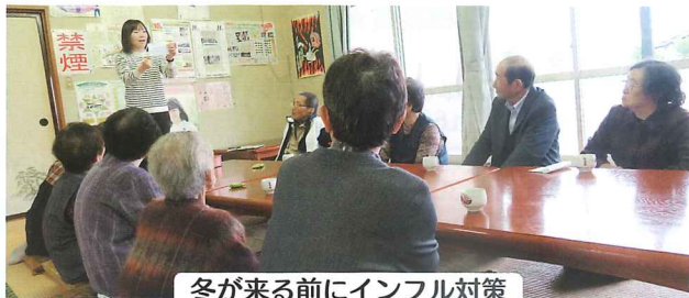
冬が来る前にインフル対策