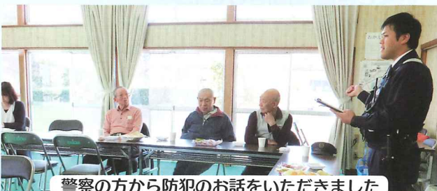
警察の方から防犯のお話をいただきました