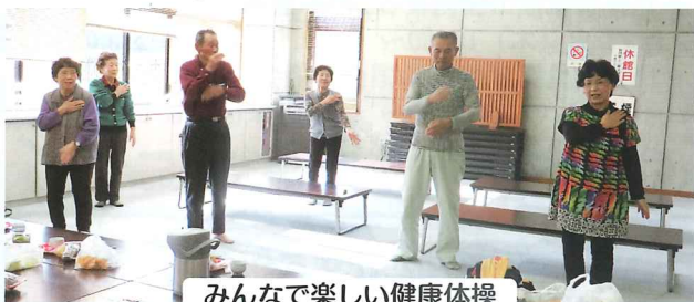
みんなで楽しい健康体操