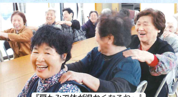
『肩もみで体が温かくなるね〜』