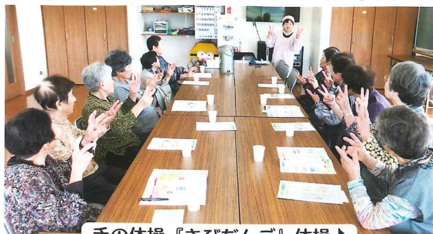
手の体操『きびだんご』体操♪