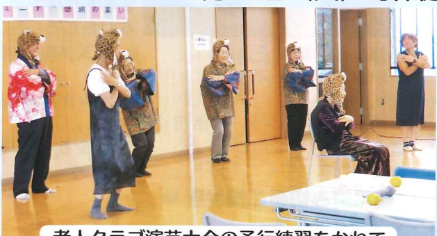
老人クラブ演芸大会の予行練習をかねて