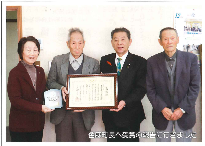
色麻町長へ受賞の報告に行きました

11月26日、27日に埼玉県で第48回全国老人クラブ大会が行われ、色麻町老人クラブ連合会が女性部会での県老連のモデル指定を受け、10年間継続して行っている友愛訪問活動が認められ、優良老人クラブ連合会表彰を受賞いたしました。本当におめでとうございます。