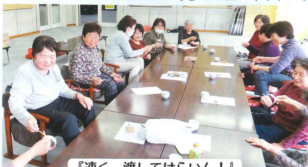
『速く、渡してけらいん！』