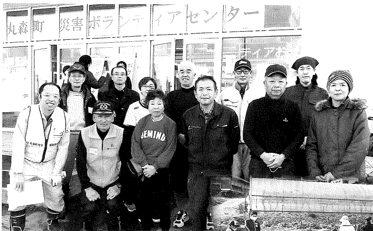
参加いただいた町民の方々と一緒に📷

台風19号において被害があった丸森町に、11月30日町民の方々と一緒にボランティアへ行ってきました。当日は、側溝に流れ込んだ土砂の泥あげを行いました。県内外から多くのボランティアが来ており、他の団体と交流を図りながら活動を行いました。