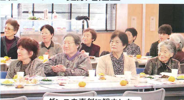
ダンスを真剣に観ました。