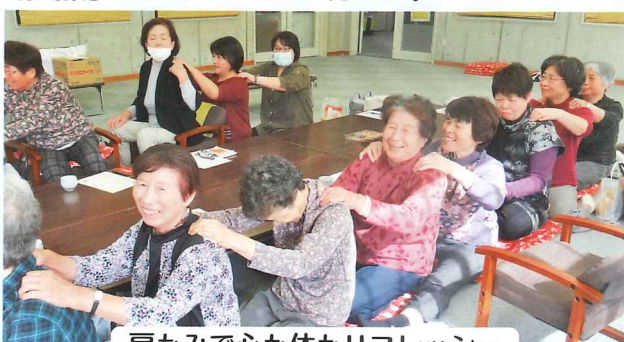
肩もみで心も体もリフレッシュ