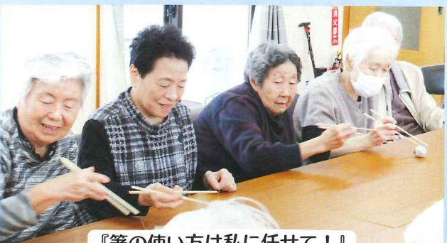
『箸の使い方は私に任せて！』