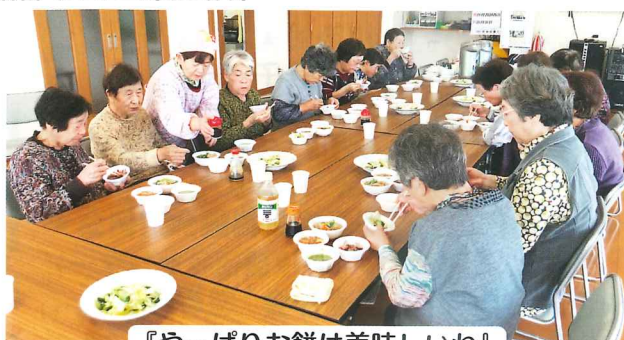
『やっぱりお餅は美味しいね』