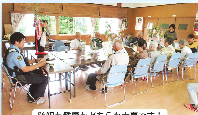
防犯も健康もどちらも大事です！