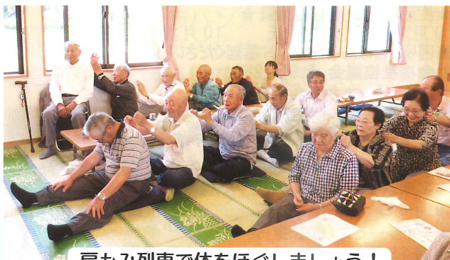
肩もみ列車で体をほぐしましょう！