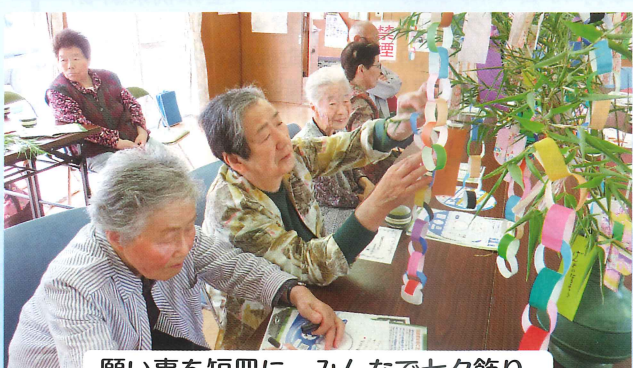
願い事を短冊に。みんなで七夕飾り。