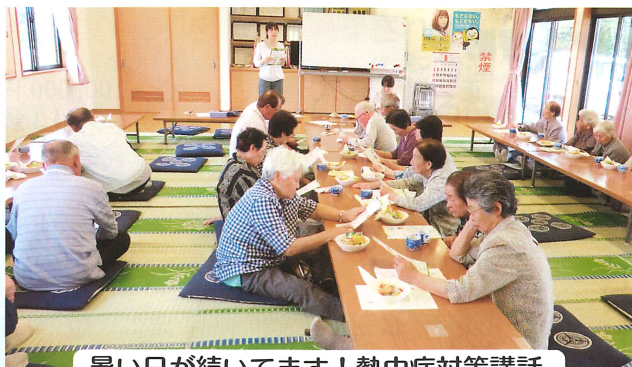
暑い日が続いてます！熱中症対策講話。