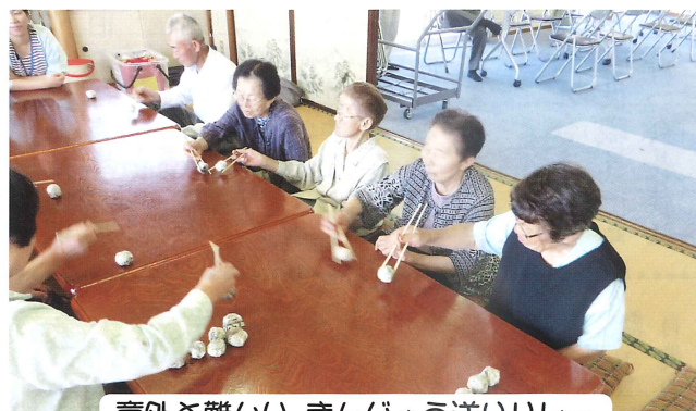
意外と難しい まんじゅう送りリレー