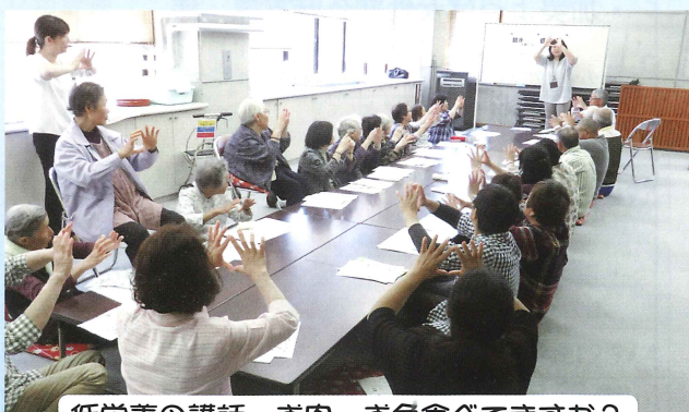
低栄養の講話。お肉・お魚食べてますか？