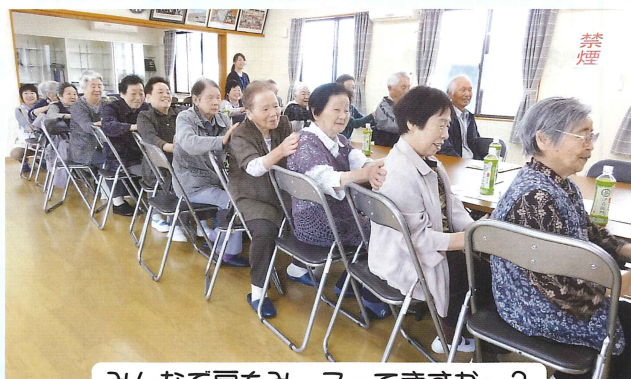
みんなて肩もみ。こってますか？