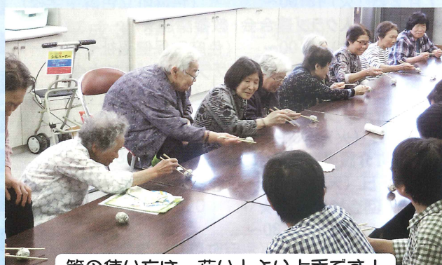
箸の使い方は、若い人より上手です！