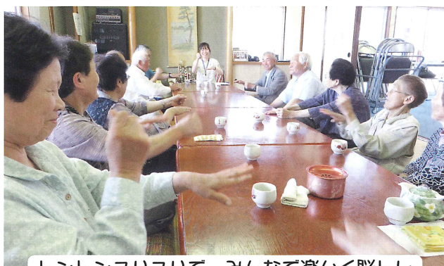
トントンスリスリで、みんな楽しく脳トレ