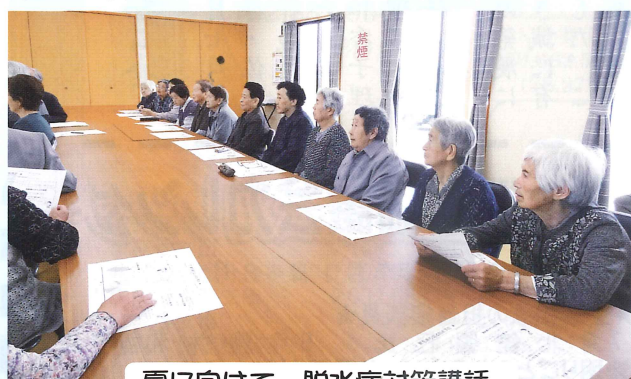
夏に向けて。脱水症対策講話。