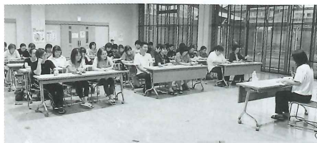
虐待防止、交通安全など、講師を招いてさまざまなテーマの講習を受けています。

色麻町社会福祉協議会では、職員個人の成長と職員間の情報共有、連携強化のためにさまざまな内部研修を行っています。