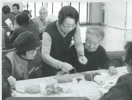
おしゃべりを交えながら、 楽しく制作しました。

※友愛訪問活動とは、老人クラブのシルバーリーダーが、一人暮らし、高齢者二人暮らし、日中高齢者世帯などを対象に、声かけや訪問をしてお話することで孤独や閉じこもりの無い生活を送るために支援をする活動です。