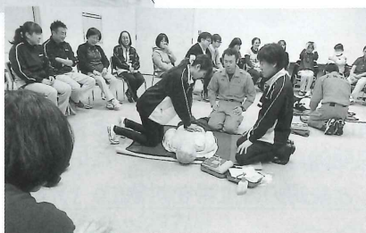
心臓マッサージやAEDの使用方法など、救急救命についての研修を受けました。