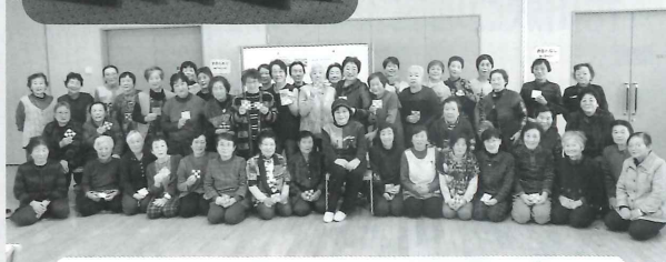
完成したコースターを持って、記念撮影！ 喜んでもらえるといいなあ～！