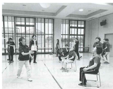
誰でも楽しめるニュースポーツ、風船バレーを実際に体験して学びました。