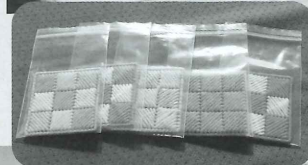
完成したコースター