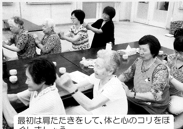
最初は肩たたきをして、体と心のコリをほぐしましょう。