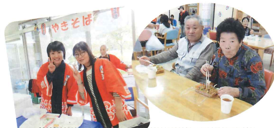
デイサービスセンター屋台