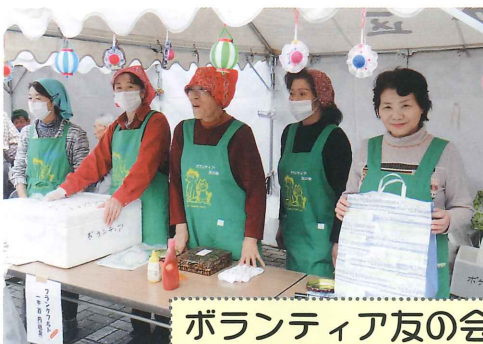
ボランティア友の会 (軽食・バザー)