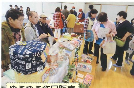
ゆうゆう作品販売