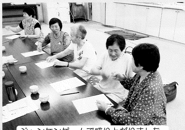
ジャンケンゲームで盛り上がりました。