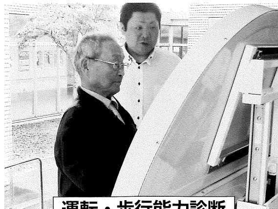
運転・歩行能力診断