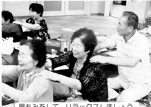
肩もみをして、リラックスしましょう。