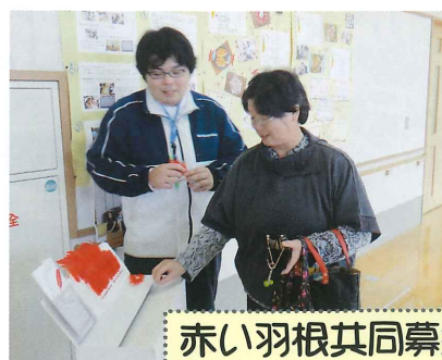
赤い羽根共同募金

来てくださった皆様、ありがとうございました。保健福祉センターまつりを通じて、社協について知って頂けたでしょうか。これからも色麻町社会福祉協議会をよろしくお願いします。