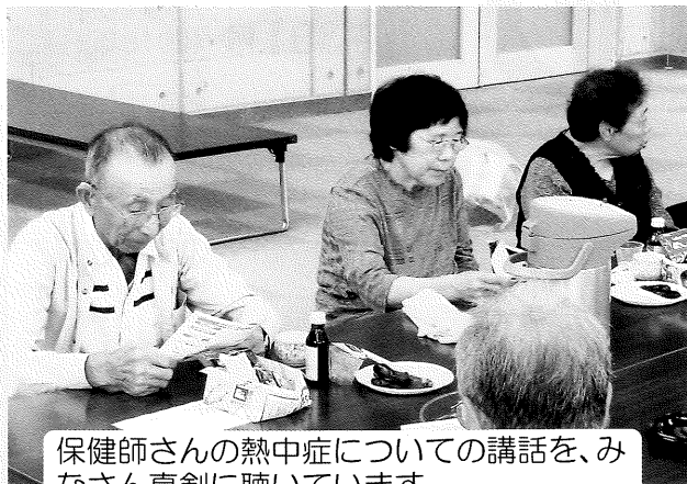
保健師さんの熱中症についての講話を、みなさん真剣に聴いています。