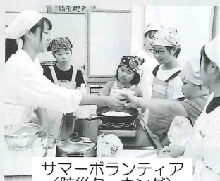
サマーボランティア （防災クッキング）