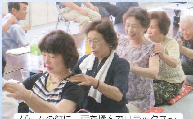
ゲームの前に、肩を揉んでリラックス～。