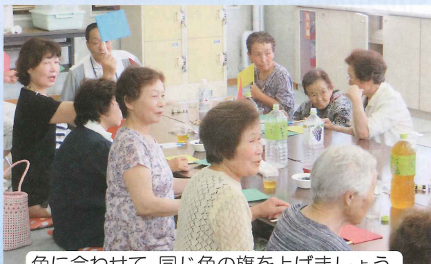
色に合わせて、同じ色の旗を上げましょう。