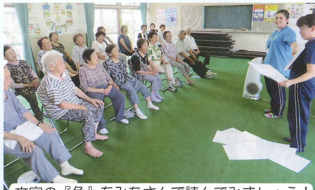
文字の『色』をみなさんで読んでみましょう！