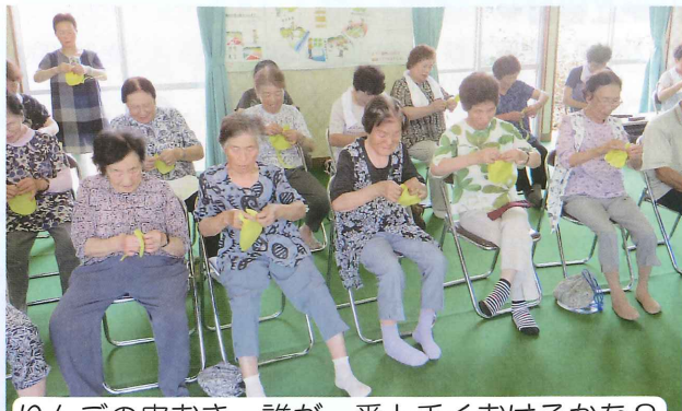
りんごの皮むき、誰が一番上手くむけるかな？