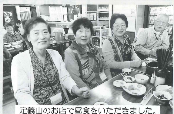
定義山のお店で昼食をいただきました。 美味しかったあ～！