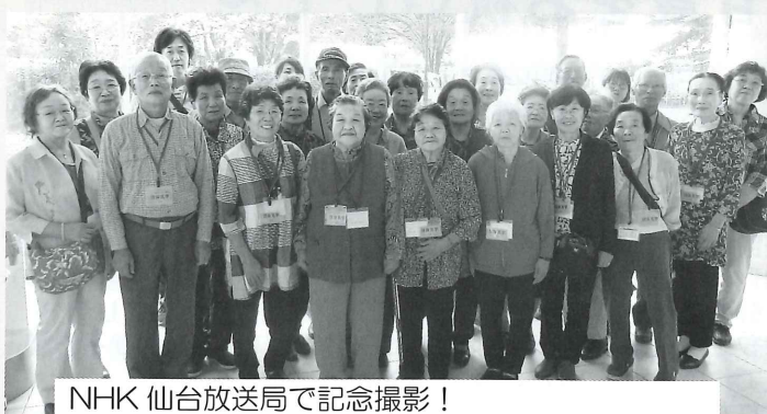
NHK 仙台放送局で記念撮影！ 普段は入れないスタジオを見せていただきました。

※さわやか会とは…町内の70歳以上の一人暮らしと夫婦のみ世帯を対象に、行事を開催しています。