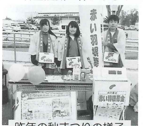
昨年の秋まつりの様子