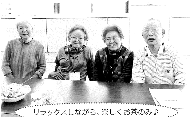
リラックスしながら、楽しくお茶のみ♪

※さわやか会とは…町内の70歳以上の一人暮らしと夫婦のみ世帯を対象に、行事を開催しています。