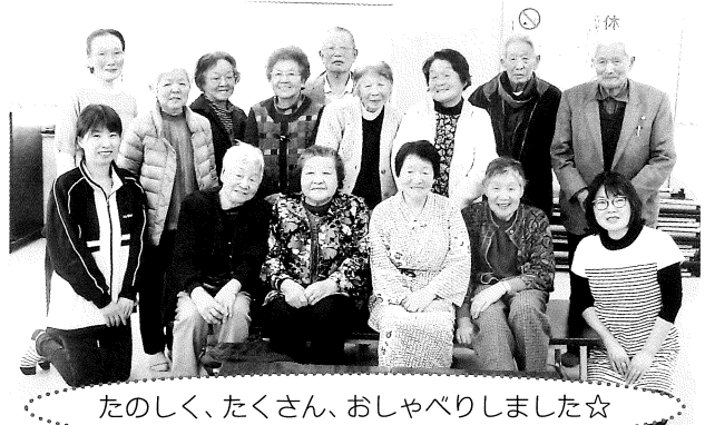
たのしく、たくさん、おしゃべりしました☆