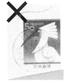
あらかじめ印刷された切手