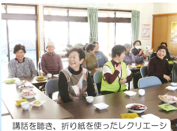
講話を聴き、折り紙を使ったレクリエーションを行いました。みなさん楽しそう！