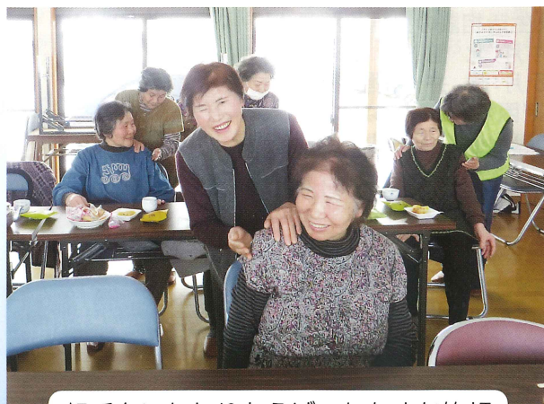
相手をいたわりあえば、たちまち笑顔