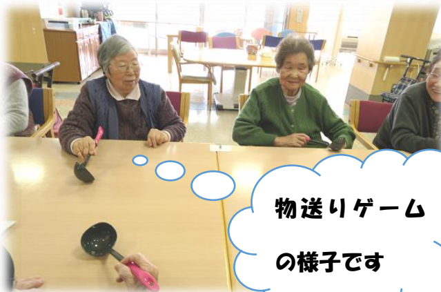
物送りゲーム の様子です