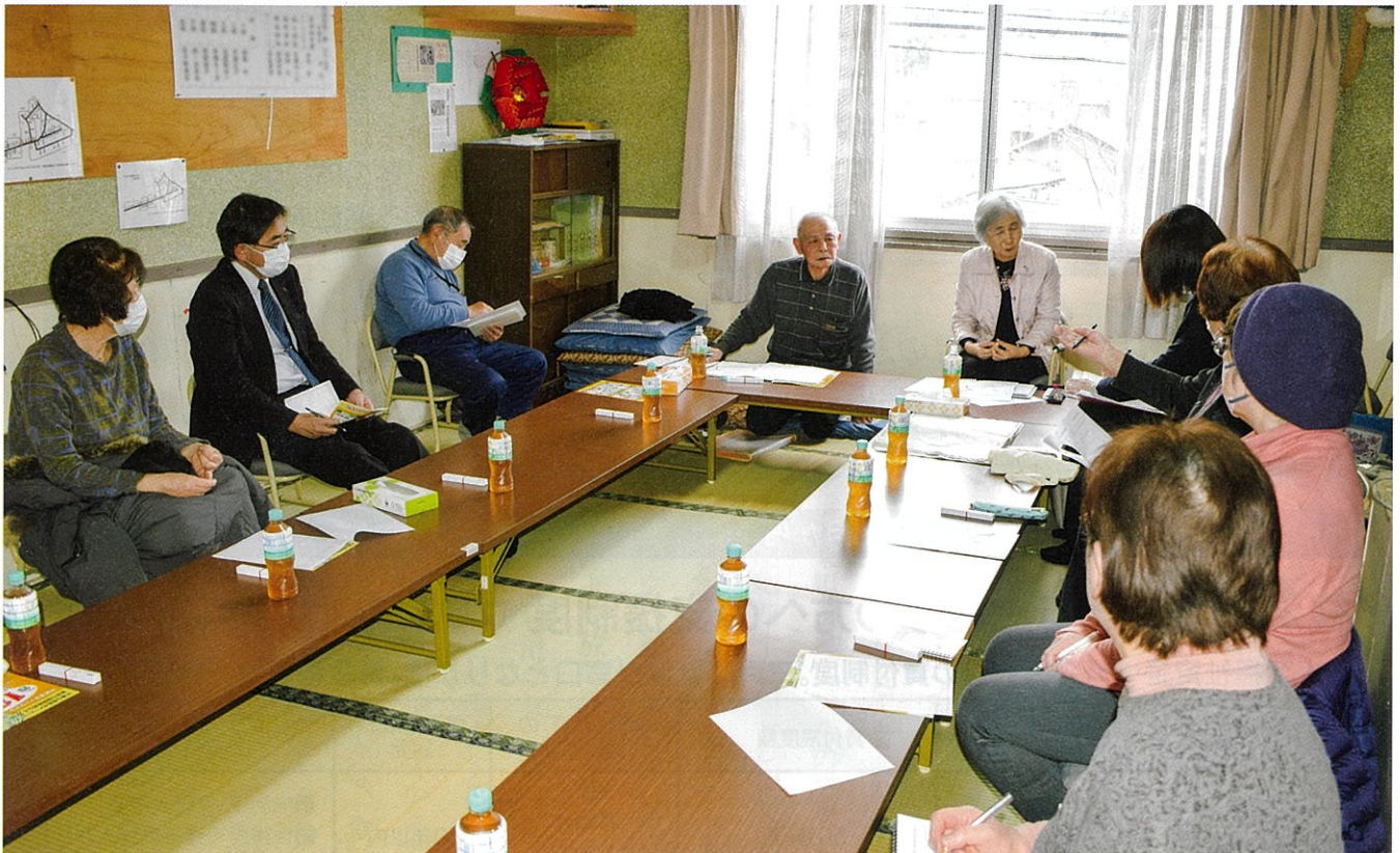
高齢の方などを地域で見守る、ほのぼの見守りネットワーク事業 下在府小路町町内会での情報交換会の様子（R6.3.1 町内会館）

住み慣れた地域で、だれもが安心して暮らせるような福祉社会をめざしてがんばります!!