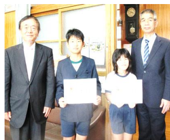
ボランティア認定証