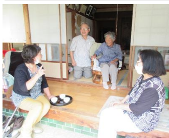
きゅううがめら見守り