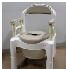
ポータブルトイレ