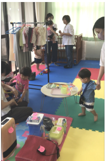
ファミサポ交流会＆フリーマーケット