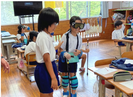
福祉体験学習 龍瀬小学校4年 総合的な学習の時間