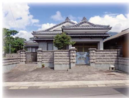
さかど結いの家 【内之浦校区】

「結いの家」とは、空き家を活用した寄り合いの場や生活支援サービスを住民みずから話し合って企画・実施する「支え合い拠点」です。現在、肝付町には各地区に5つの「結いの家」があり、サロンや子ども食堂などの活動、「暮らしの保健室」などで健康についての相談ができる場となっています。