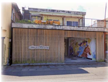
おじゃんせ結いの家 【高山校区】