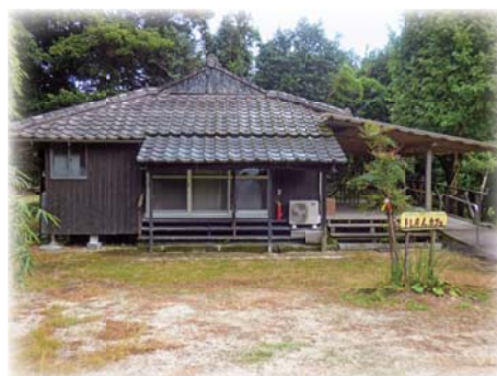
きしたん結いの家 【岸良校区】