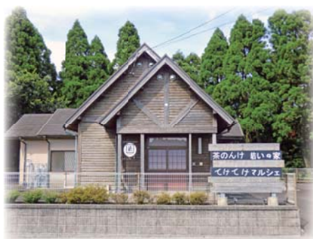
茶のんけ結いの家 【国見・川上校区】

編集発行：肝付町社会福祉協議会 【やぶさめの里総合公園福祉会館内】 TEL：0994-68-8188 FAX：0994-68-8187 https://www.shakyo.or.jp/hp/1761/