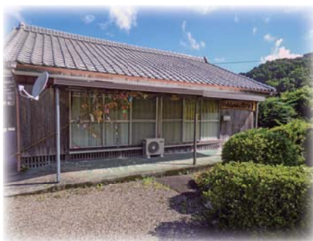
いったんもめん結いの家 【波野・有明校区】