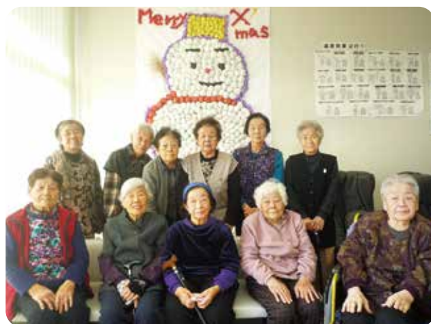
立派な「雪だるま」が出来ました。 ♪メリークリスマス♪