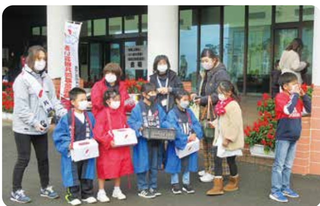
大きな声で呼びかけを頑張りました