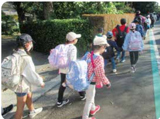
マンダリンセンターまでがんばるぞ！

児童の中には、木に実ったミカンを手で摘み取るのが初めての子どももいましたが、全員袋からこぼれ落ちるほど、ミカン狩りを楽しみました。