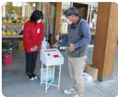
だんだん市場での募金活動

募金活動に「頑張っね」という声をたくさんいただき、寒い中でしたが、とてもあたたかい気持ちになりました。ご協力いただき、本当にありがとうございました。