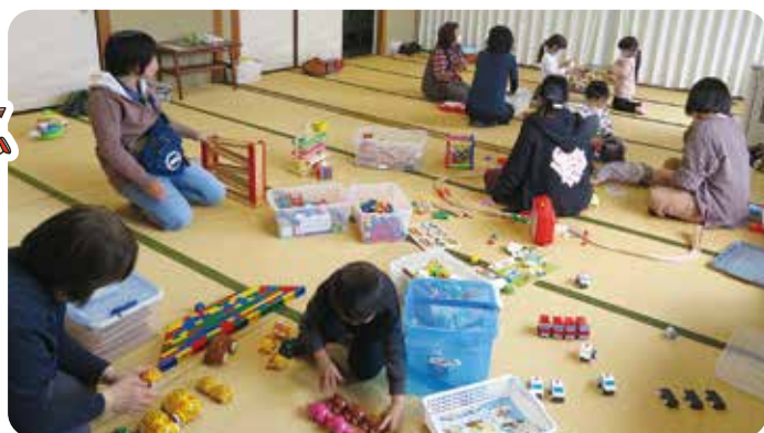
たくさんの親子が遊びに来てくれました