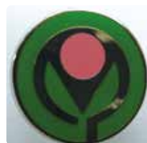
小さな親切運動実行章

学校、育成会、個人でも始められます。興味を持たれたらカードを渡しますので、お問い合わせください。（電話 86-0190）