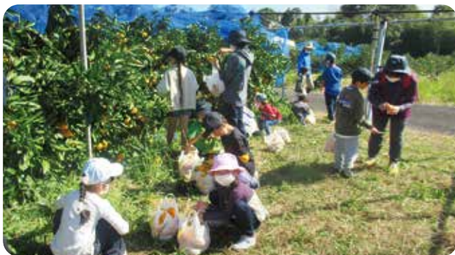
美味しそうなミカンがたくさん！