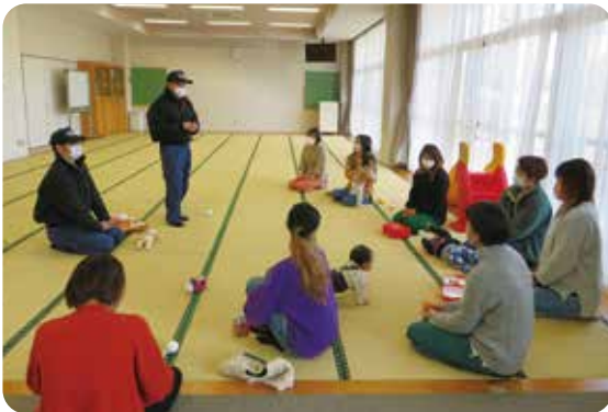
突発的な事故の対応について学びました