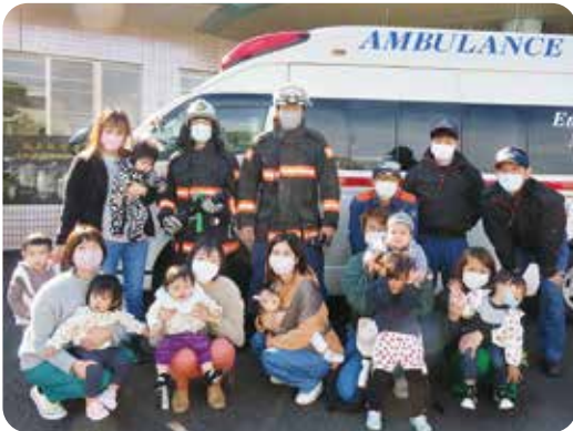
消防士さんたちとハイポーズ！

12月8日に東分遣所の職員による緊急車両の見学と応急処置講座を開催しました。 ひろばにいる子どもたちは、消防車と救急車の登場に歓声を上げ、大喜び。外に出て、消防士さんたちにご挨拶をして、実際に消防車と救急車に乗せてもらったり、写真撮影をしたり、消防の道具を触らせてもらったり、消防士さんによる放水も見ることができ、大満足でした。 見学が終わった後、ひろば内に入り、乳幼児の誤飲や火傷など突発的な事故が起きた時の対応を教えていただきました。