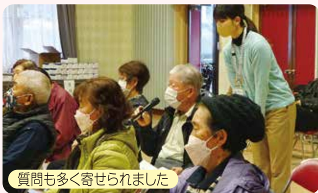
質問も多く寄せられました