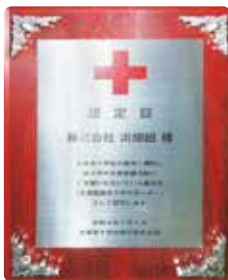
赤十字サポーター認定証

日本赤十字社のサポーターとして、今後ともご協力いただきます。どうぞよろしくお願いいたします。