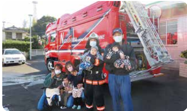
大好きな消防車と…