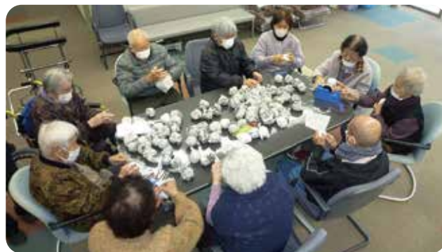
何が出来ののかなあ～ 皆と一緒に「ニギニギ」

楽しくおしゃべりをしながら、作業をすめます。ふとしたきっかけで、昔話がはずむこともよく見られる光景です。