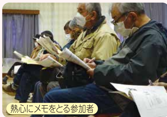
熱心にメモをとる参加者