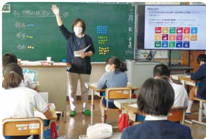
ファシリテーターによるSDGsの学習