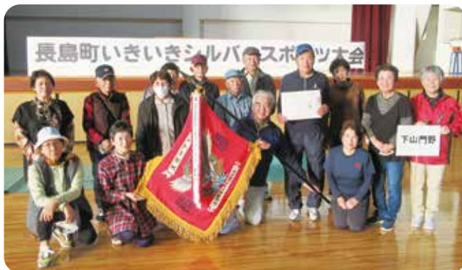
優勝した下山門野チームの皆さん