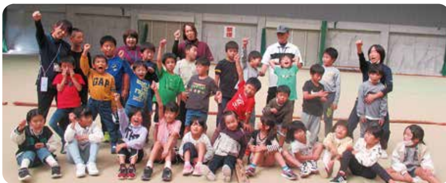
楽しい遠足になりました！