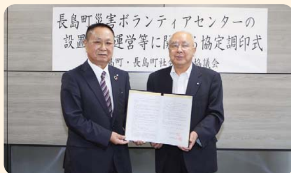
災害ボランティアセンター協定調印式

これは、法律の改正に伴い、長島町において甚大な被害をもたらす災害が発生し、国の災害救助法の適用を受けることが決定した場合に、災害ボランティアセンターで行う救助とボランティア活動の調整に必要な人件費及び旅費が、国庫負担でまかなわれることに関する協定です。