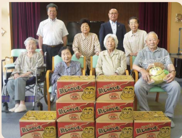
寄贈のジャガイモと利用者

福祉体験学習についてのお問合せは 長島町社会福祉協議会(電話 86-0190) まで