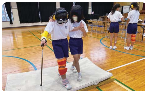
マットの段差を歩く体験

高齢者のかたの見え方や聞こえ方、関節のあがりにくさ、車いすの体験をとおし、周りのサポートの大切さを感じとっていたようです。