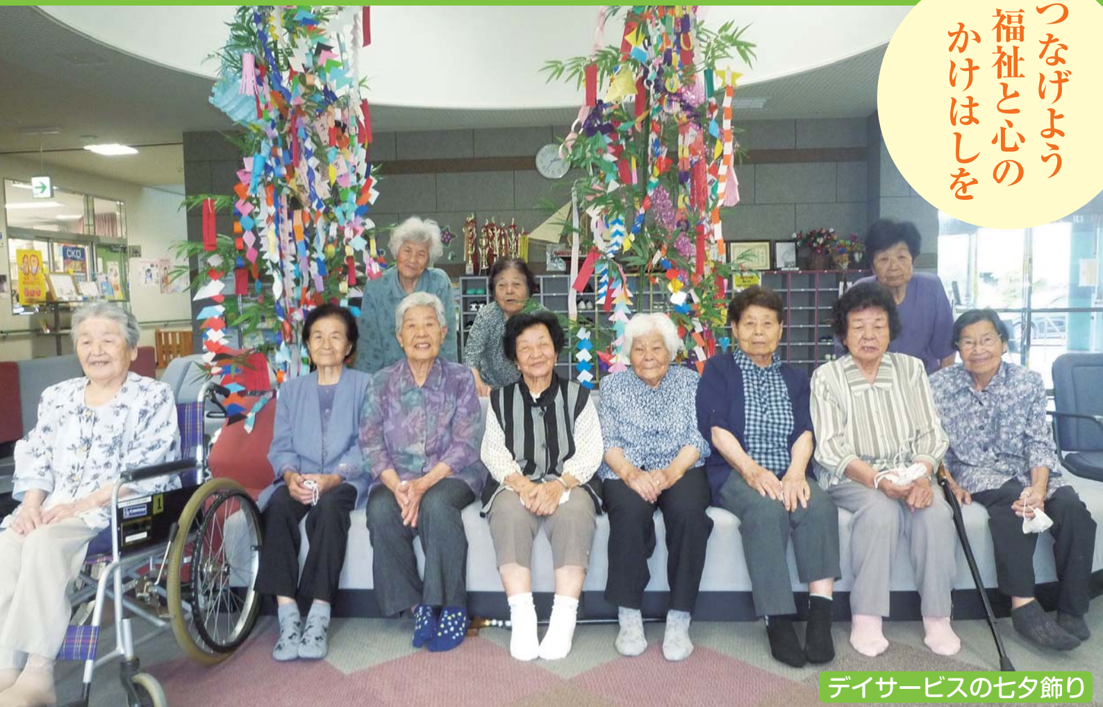
デイサービスの七夕飾り