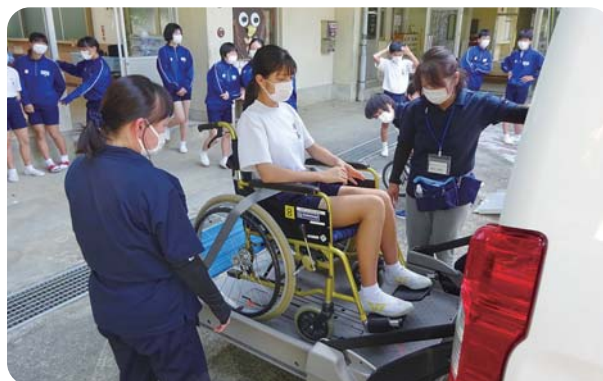
車いすリフト乗車体験