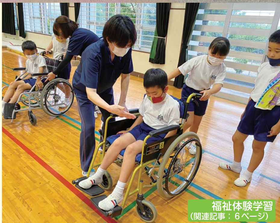
福祉体験学習 (関連記事: 6 ページ)