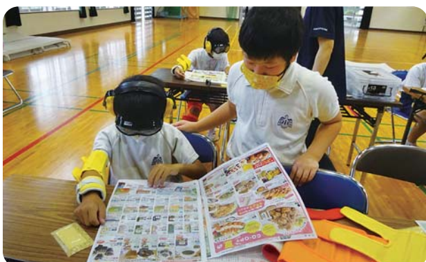
白内障・視野狭窄(きょうさく)症の見え方の体験