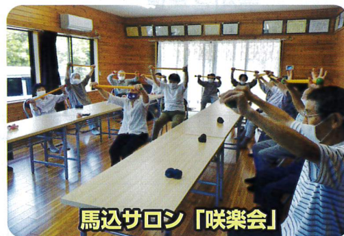
馬込サロン「咲楽会」