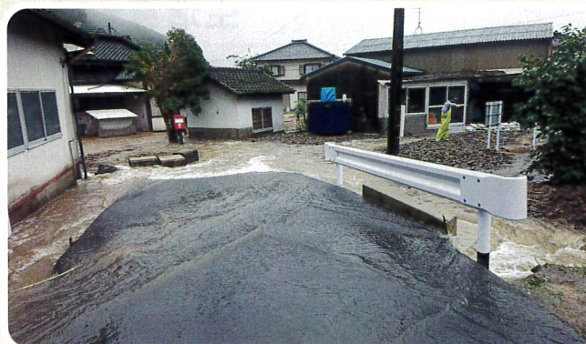
《今回の豪雨による長島町内の状況》