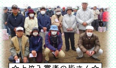
☆上位入賞者の皆さん☆