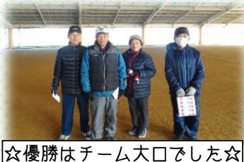
☆優勝はチーム大口でした☆