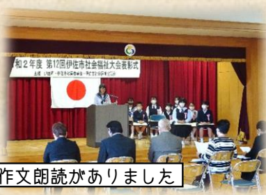
優秀賞の児童生徒による作文朗読がありました