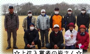
☆上位入賞者の皆さん☆