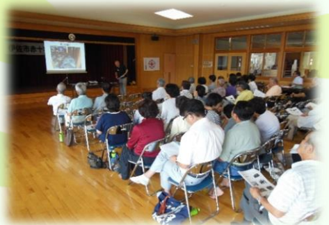
日赤県支部職員による講話