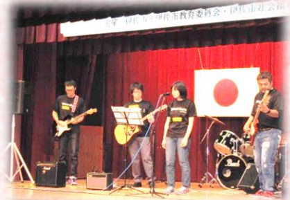
すいせん会によるバンド演奏