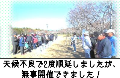
天候不良で2度順延しましたが、 無事開催できました！