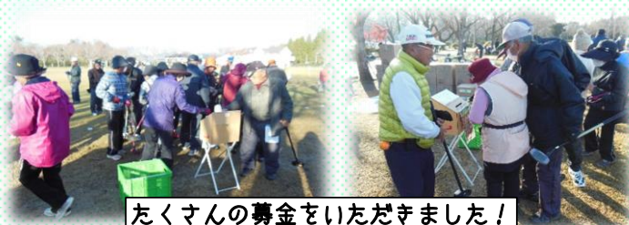
たくさんの募金をいただきました！