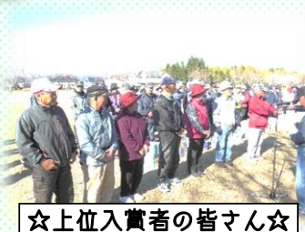
☆上位入賞者の皆さん☆