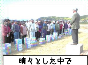
晴々とした中で プレー終了し閉会式！