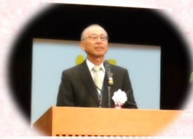
大会会長(隈元市長)あいさつ