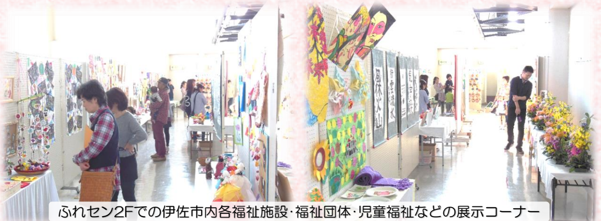
ふれセン2Fでの伊佐市内各福祉施設・福祉団体・児童福祉などの展示コーナー