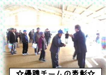
☆優勝チームの表彰☆