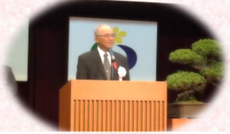
大会副会長(周防原社協会長)あいさつ