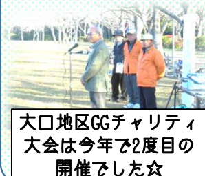
大口地区GGチャリティ 大会は今年で2度目の 開催でした☆