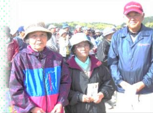
☆上位入賞者の皆さん☆