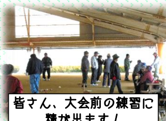
皆さん、大会前の練習に 精が出ます！