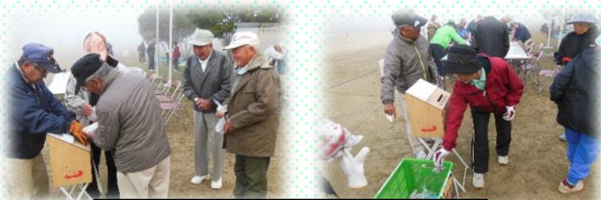
たくさんの募金をいただきました！