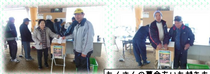
たくさんの募金をいただきました！