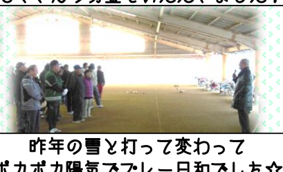
昨年の雪と打って変わって ポカポカ陽気でプレー日和でした☆