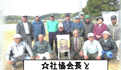
☆社協会長と 菱刈GG役員の皆さん☆