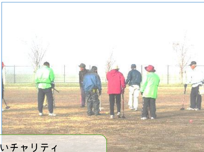
歳末たすけあいチャリティ グラウンドゴルフ大会・ゲートボール大会