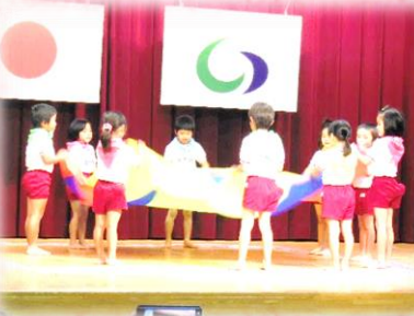
羽月保育園児によるおゆうぎ