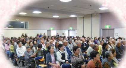
たくさんの市民の方に式典 をご覧いただきました！