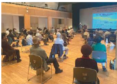
10月28日：国分シビックセンター＊62名