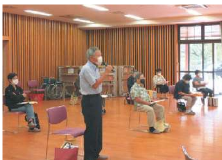
10月13日：牧園農村活性化センター＊15名