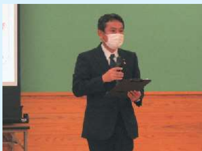
中重市長から、7地区すべてで心温まるごあいさつ

「うちの地域でも何かしたい」「でも、何をしたら良いやら…」「困ったとき」「自分たちの地域活動を自慢したいとき」いつでも下記までご連絡ください。