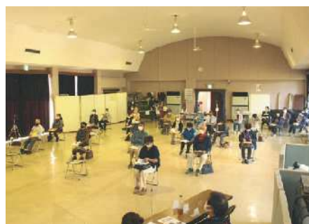
10月22日：霧島公民館＊25名