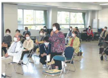
11月5日：天降川共同利用施設＊39名