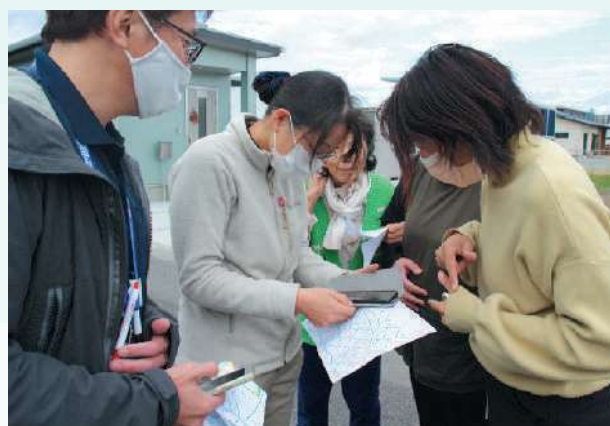
アプリに記載されている情報を基に行方不明者を搜索しました

訓練に参加された方からは「一人でも多くの市民が搜索依頼を受けると、それだけ早く発見できるので、知り合いに広めたい」「アプリを使用すると搜索依頼が簡単にできるうえ、行方不明者の写真等、詳細な情報が掲載されるので探しやすい」との感想がありました。