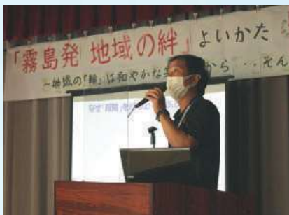
【講話】 霧島市における地域づくりの現状と課題 「顔の見える関係づくり」を深めるために取り組まれている実践のご紹介