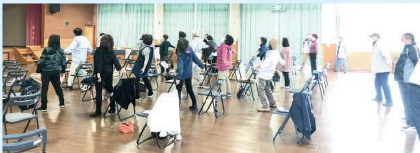
みんなでできるラジオ体操～鹿児島弁バージョン～