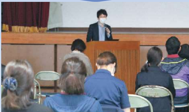
講師からアプリ制作に至った熱い想いが語られました

11月1日（月）、国分体育館で霧島市「みまもりあいプロジェクト」の第一弾として「搜索支援アプリ」の体験会を開催しました。