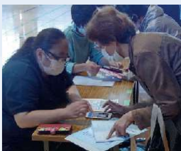
体験会前にアプリのダウンロードも行ってもらいました

そのため、従来の搜索方法だけではなく、スマートフォンアプリを活用し、行方不明者の早期発見を行うため、今後はアプリの普及活動を行っていきます。