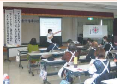
わかりやすい講話でした

当日は、新型コロナウイルス感染予防対策を行った中で30人の参加のもとで開催され、短い時間の中ではありましたが、出席者からは「介護の知識と技術について学び直すいい機会になった」等の意見があり、有意義な時間を過ごされていました。