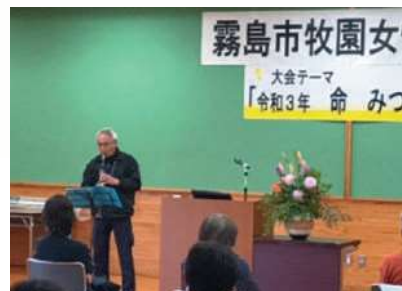
きれいな音色に癒されます

2部では「ふれあいコンサート」として、社会福祉協議会牧園支所の職員によるクラリネットのソロ演奏会が行われ、参加者からは「懐かしい曲を聴くことができました。素敵な時間をありがとうございました。」と感想が寄せられました。とても充実した研修会となりました。