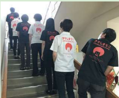
信じようよ!! 未来は明るい☺