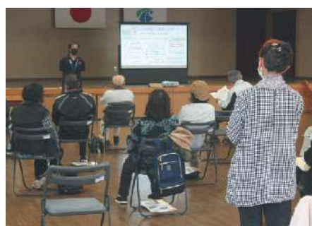
11月19日：福山活性化センター＊41名