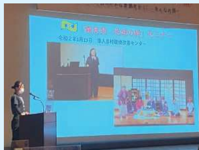
これまでの「霧島発 地域の絆」プロジェクトの振り返り