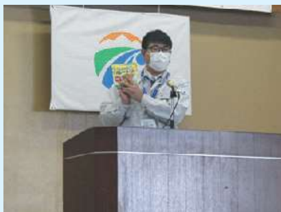
「災害に備えて」霧島市安心安全課より、ローリングストックについて