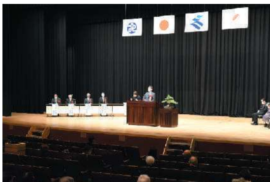
塩田知事からの主催者あいさつ