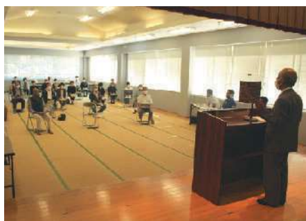
10月19日：横川健康温泉センター＊20名