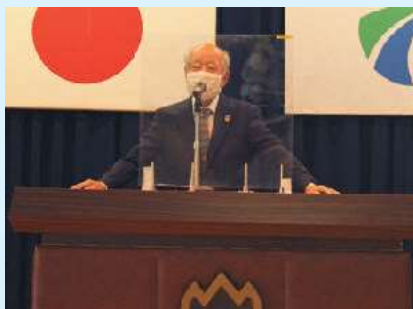
福永会長から、主催者としての思いを込めたあいさつ