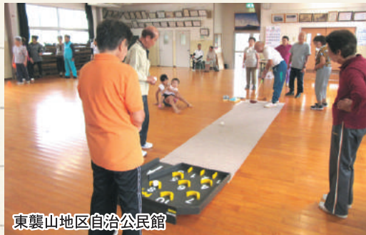
東襲山地区自治公民館