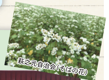
萩之元自治会(そばの花)