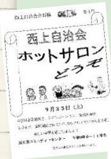
西上自治会 手作りチラシと活動記録