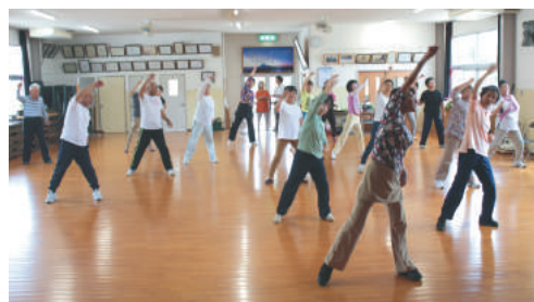
ハツラツとリズム体操