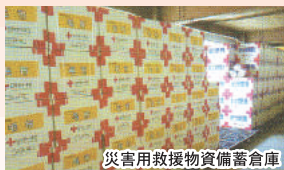
災害用救援物資備蓄倉庫

平成28年熊本地震では、被災された方々に対し医療救護班による診療活動などを実施し、救援物資（毛布やタオルケット）をお届けしました。赤十字は、災害時に迅速に救援物資をお届けできるよう、備蓄を行っています。