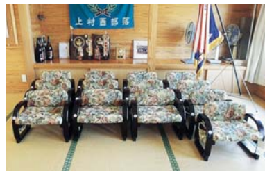
座椅子整備(上村西自治会)