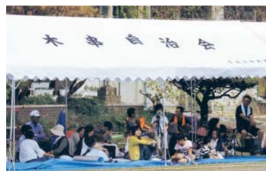
テント整備(木串自治会)