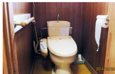
和式から洋式への改修(宇都野々自治会)