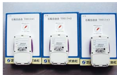
グリップコール整備(石坂自治会)