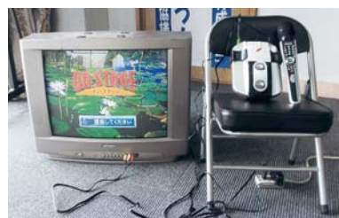
カラオケセット整備(六月田中自治会)