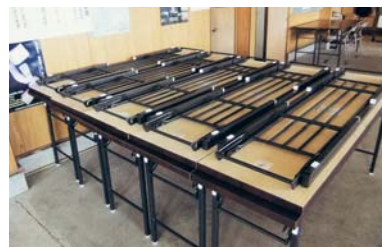
長机整備(安原自治会)