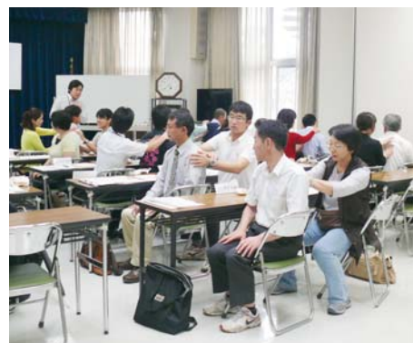
リラクゼーション

災害時の事など話だけ聞くよりも、実際に体験してみることが、身をもって想像することができました。ご飯もとても美味しく、学校の現場でも子どもたちに体験させてみたいなあと思いました。