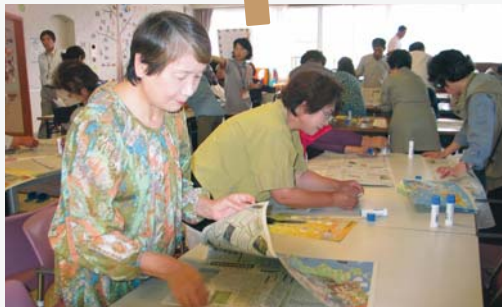
新聞紙でのエコバッグ