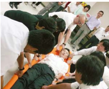
毛布で担架づくり