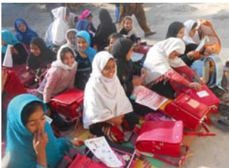
参考資料: ジョイセフ

平成26年3月、190個のランドセルと未使用の文房具をアフガニスタンへ発送しました。アフガニスタンでは、多くの子どもたちが教科書やノートを布に包んで片道10km以上離れた青空教室で勉強しています。