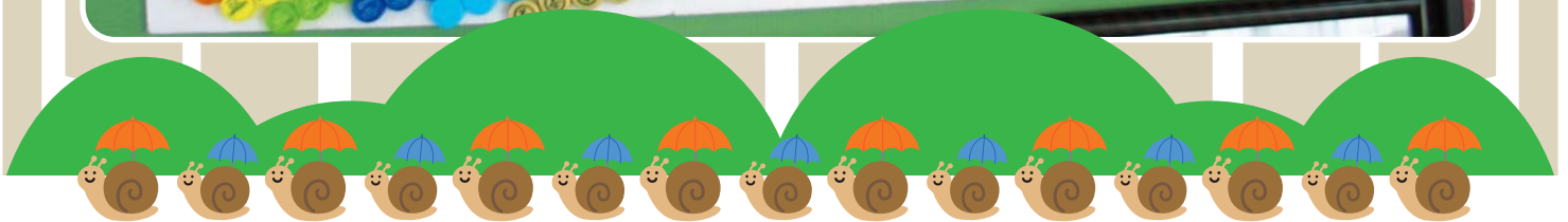
キャップ収集マスコット「キャプテン キャップ君」