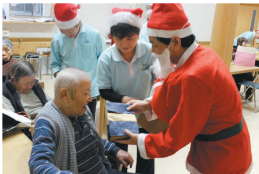
サンタさんからのプレゼント♪

グループホーム野菊で、12月25日に利用者と職員、ボランティアでクリスマスパーティを開催しました。キラキラに飾り付けられたツリーを囲み、ケーキやローストチキンなどご馳走をみんなで食べました。地元のボランティアによる、楽しい踊りも披露され、楽しいひと時を過しました。