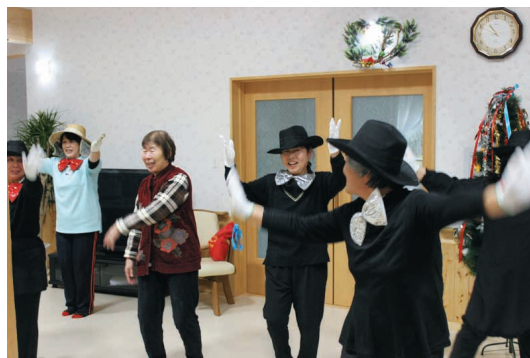
利用者さんもう一緒に踊りました