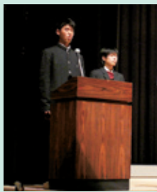
司会をつとめてくれた高校生