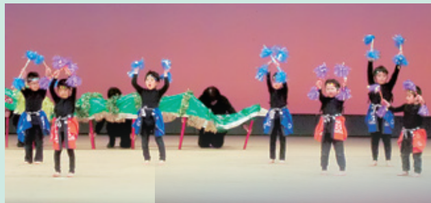
野田保育園の 龍神太鼓