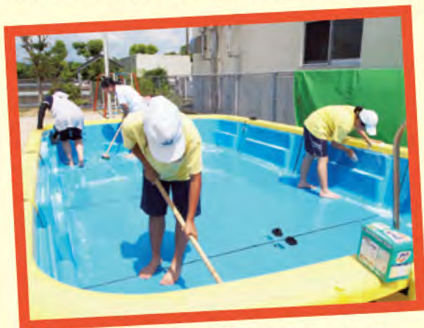
プールのあとはおそうじをします