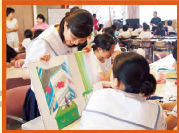
本番に向けて練習も笑顔で