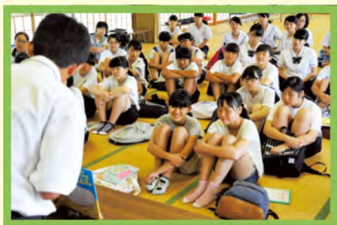
皆の前で読み聞かせ、緊張してます

私は保育に小学5年生のときから興味をもちましたが、まだ保育についてよくわからないので、サマーボランティアに申し込みました。初めてなので不安でいっぱいでしたが、今日の事前学習で楽しみという気持ちが増え、不安が少なくなりました。絵本の読み方はまだ上手にできないけれど、「聞こえる声で、見やすいように、心をこめて」の3つをしっかり守って、本番で子どもの気持ちをつかまえられるように頑張りたいです。