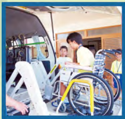
車イス専用の車に乗車体験