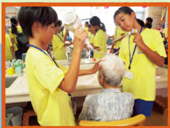
おフロのあとのドライヤー 「熱くないですか」