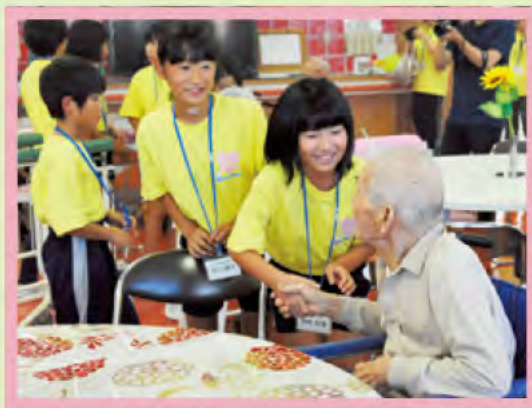
今日一日ありがとうございました