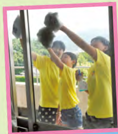
3人で力を合わせて窓ふき きれいになりました