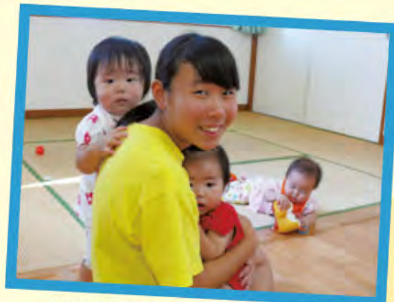
かわいくて抱きしめちゃいます