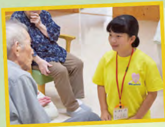
自己紹介は大きな声で

どうすれば、施設の方、利用者さんに楽しく思ってもらえるのかを工夫して話したり活動することが新鮮で、よい経験になりました。