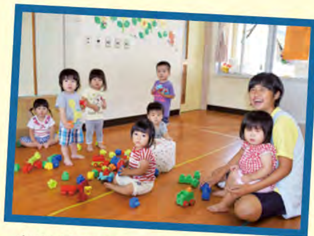
小さい子のクラスは驚きがいっぱいです