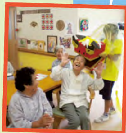
獅子舞にかまれると 幸せになるそうなので