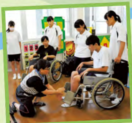
車イス介助の仕方