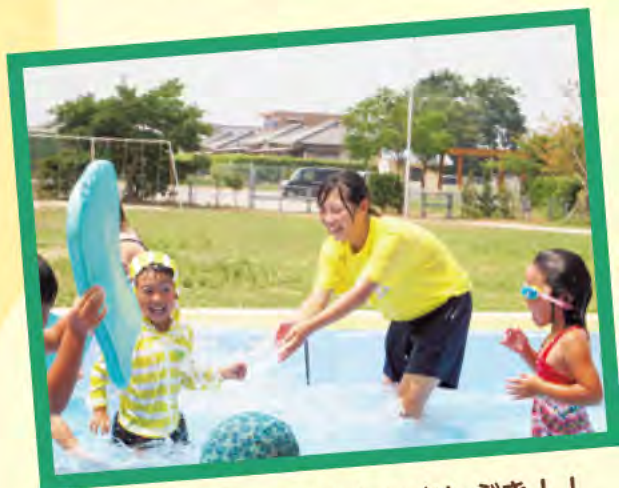
プール遊びに参加楽しい水しぶき！！

出水市内の小学5年生～高校3年生までの児童・生徒が夏休みの期間を利用して保育園、高齢者施設、児童クラブなどで実際にボランティア体験しました。サマーボランティアは様々な人たちとふれあいながら「共に生きる」豊かな心を育て、福祉への理解を深めることを目的に毎年開催しています。今年は市内35カ所の施設で、計393人の参加がありました。受け入れにご協力いただきました福祉施設等の皆様方、誠にありがとうございました。