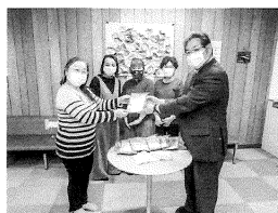
JA 浜中町女性部 マスク寄付

▼資源ボランティア(使用済切手) 浜中町役場 総務課/町民課/福祉保健課 浜中町教育委員会