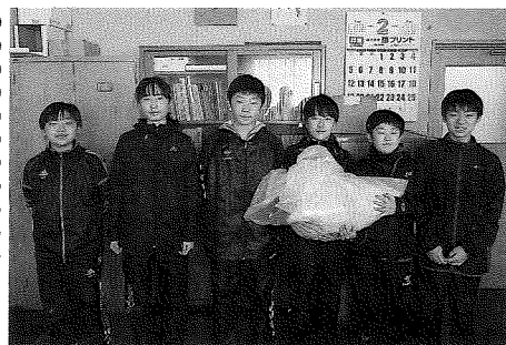
茶内小学校児童会環境委員会の皆さん