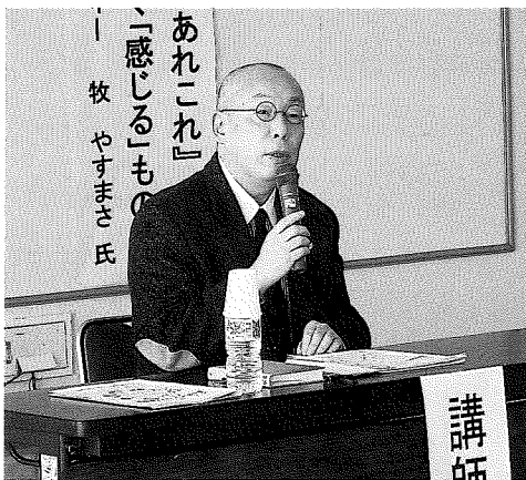
第20回記念 平成28年度 浜中町ボランティア講演

また、北海道いのちの電話との関わりも深く、人と人がきちんと助け合う「近助けあい」が大切であると、映像を交えながらお話をされ、参加された皆さんは大変興味深く聞かれていました。