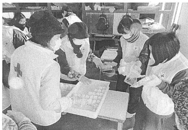
消防出初め式での炊出し訓練の様子②