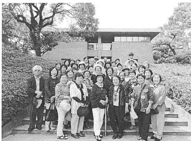
6月14日 赤十字奉仕団鹿児島研修