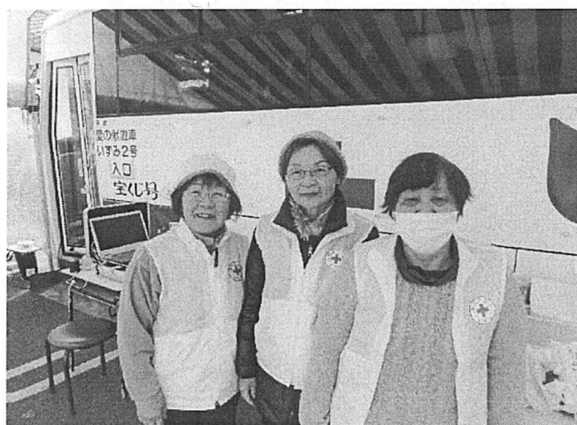
献血活動の様子（赤十字奉仕団）