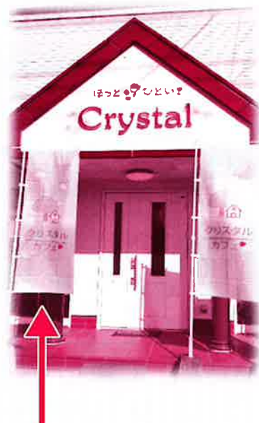
この旗が開催の目印

また、ご家族のことで不安や悩みがある方は、ひとりで抱え込まずスタッフに話してみませんか？ご希望があれば、専門の相談窓口や家族会などもご紹介いたします。 (スタッフはボランティアですが、伺ったお話を口外することはありませんので、ご安心ください。)