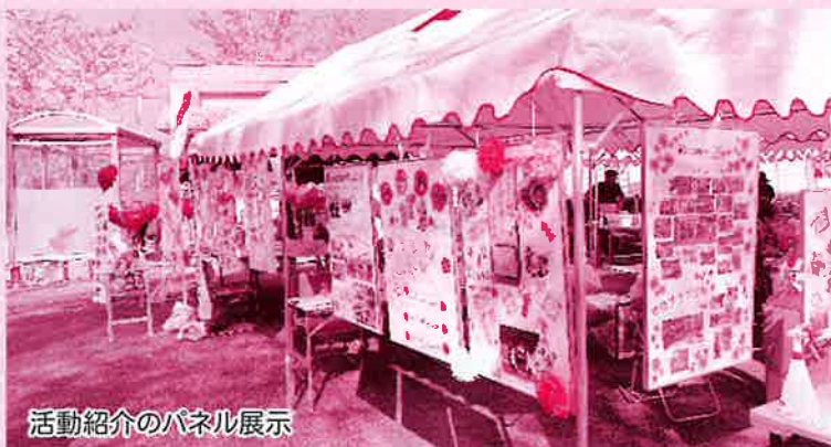
活動紹介のパネル展示