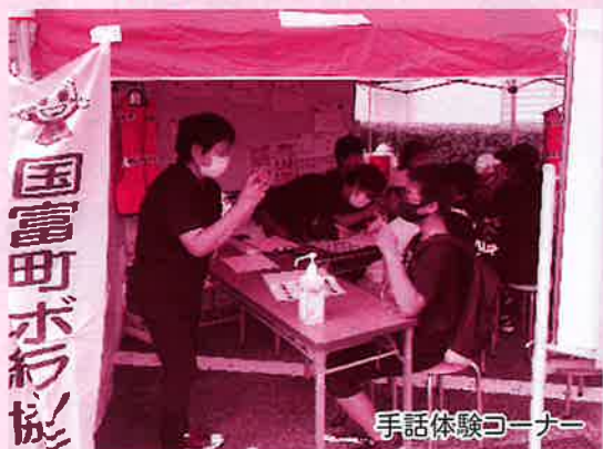
手話体験コーナー