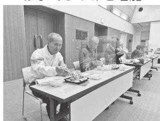
おふくろの味を堪能