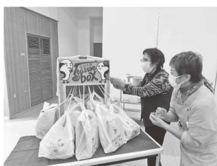
お楽しみ抽選会（宝引き）