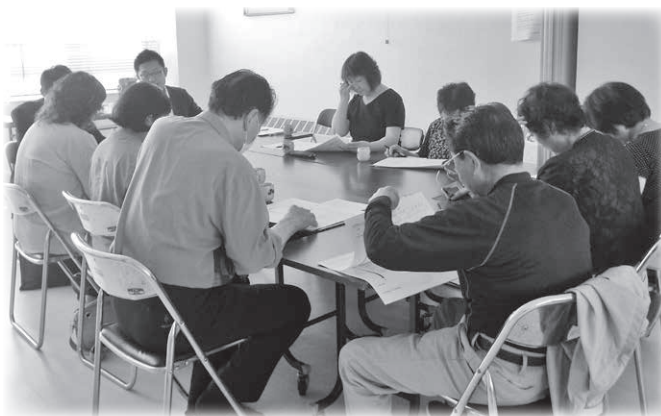
— 南浦幌地区住民座談会の様子 —

六月二十八日、吉野公民館において南浦幌地区の住民座談会を開催し住民・関係者九名に参加を頂きました。初めての開催となる今回は、地域で受けられる生活支援サービスについて、雑談を交えながらの楽しい意見交換となりました。