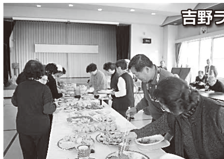
吉野ラポールの会 (南浦幌地区給食サービス)