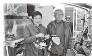
「手作りおもちゃ」頂きました