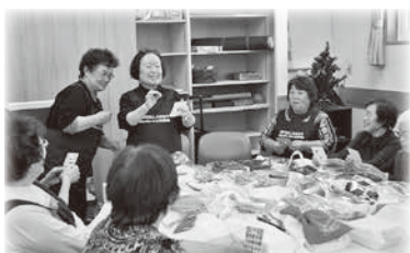
ボランティアも一緒に楽しんでいます