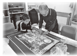
孫と一緒にジグソーパズル

▼開設へ至った思いを聞かせて下さい 以前ヘルパーとして働いていたとき、自宅以外で高齢者が出向く場所が、病院と買物くらいで、「居場所」が少ないなと感じていました。そんな人たちが気軽にやってきて思い思いに過ごせる場所を作ってあげたいと思ったのが始まりです。