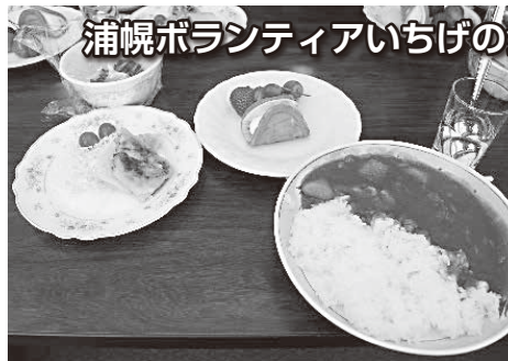
浦幌ボランティアいちげの会 (市街地区給食サービス)