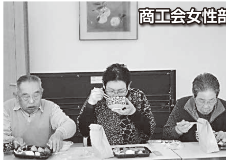
商工会女性部 (お食事会)