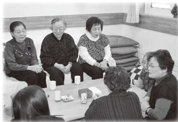
来た人が思い思いのひとときを過ごす「カフェひとやすみ」

来た人から「家に居たらこんなに大きな声で笑うことないよね」と言ってもらえたことが嬉しかったです。ただ、来て欲しいと思っていた「居場所の少ない高齢者」の利用がまだ少ないと感じています。通う手段が整っていないことや、この場所のことを理解して貰えていないからかなと思っています。一度来たら楽しんでもらえる自信があるのでもどかしいです。