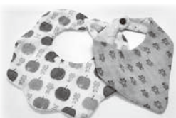
思いの詰まった「スタイ」

▼今後はどんな活動をしていきたいですか 今、みんな「スタイ」を縫って町へ寄付し、出産された家庭へ渡してもらった活動をしています。今後は、小さな子供が居る人や妊婦さん、小中学生たちも私たちや高齢者と一緒にスタイ作りができないかなと考えています。そうして、異世代間の交流が出来るよう人をつないでいきたいと思っています。