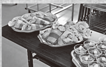
▲クレープにババロアスイーツも充実