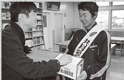
▲朝の校内で元気に募金活動