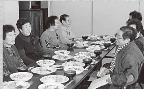
▲クリスマスのご馳走を前に