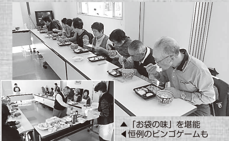
▲「お袋の味」を堪能 ◀恒例のビンゴゲームも