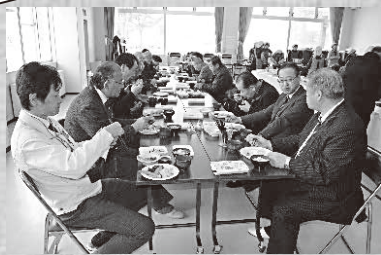
▲町長はじめ来賓も一緒にお祝い

二十周年を迎え、ますます充実の給食サービス。吉野ラポール婦人会の皆さんこれからもよろしくお願いいたします。