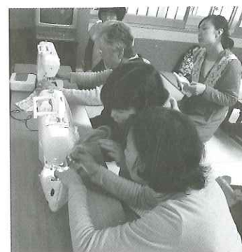
手芸ボランティアさんによる マタニティサロンでの「ポシ エット作り講座」の様子