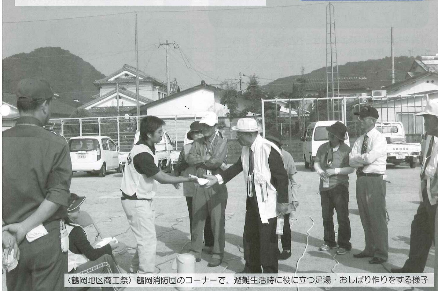
〈鶴岡地区商工祭〉鶴岡消防団のコーナーで、避難生活時に役に立つ足湯・おしぼり作りをする様子