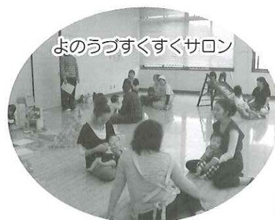
よのうづすくすくサロン