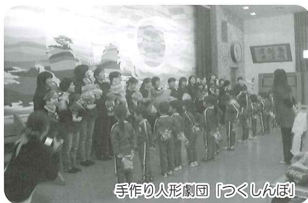
手作り人形劇団「つくしんぼ」