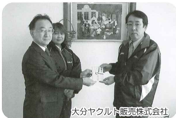
大分ヤクルト販売株式会社

年末には、中学生、高校生が寒い中を街頭募金活動に取り組み、その集まった募金を届けてくれました。心のこもった募金をお寄せ頂いた皆さま、また共同募金運動を支えていただいております区長さん、地域役員さんをはじめ、各団体・学校・企業の皆さま、誠にありがとうございました。