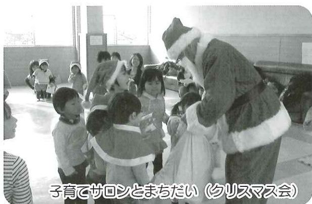
子育てサロンとまちだい（クリスマス会）