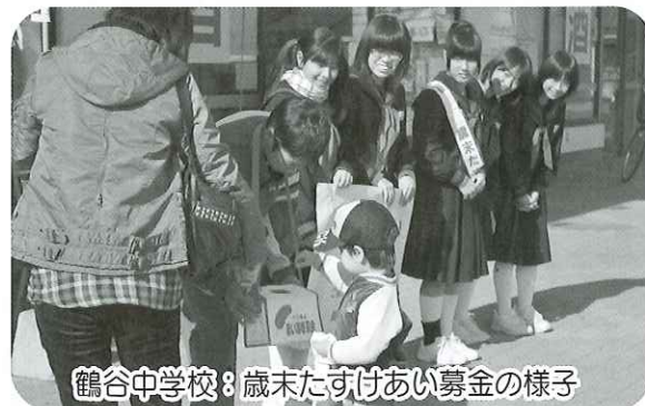
鶴谷中学校：歳末たすけあい募金の様子